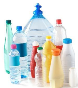
BOUTEILLES ET FLACONS PLASTIQUES