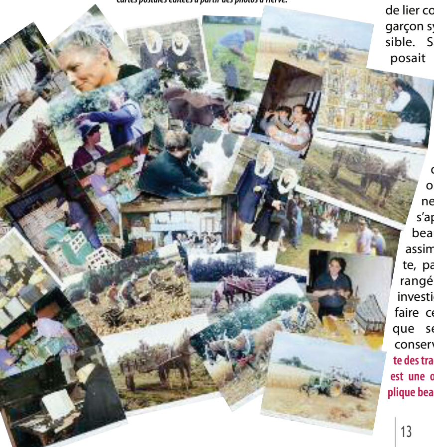
Cartes postales éditées à partir des photos d'Hervé.

En complément de cet hommage à Hervé, un texte écrit par deux jeunes étudiantes, ayant rencontré Hervé Calvez dans le cadre d'une exposition sur le cinéma amateur à la cinémathèque en 1998, est disponible sur le site de la commune.